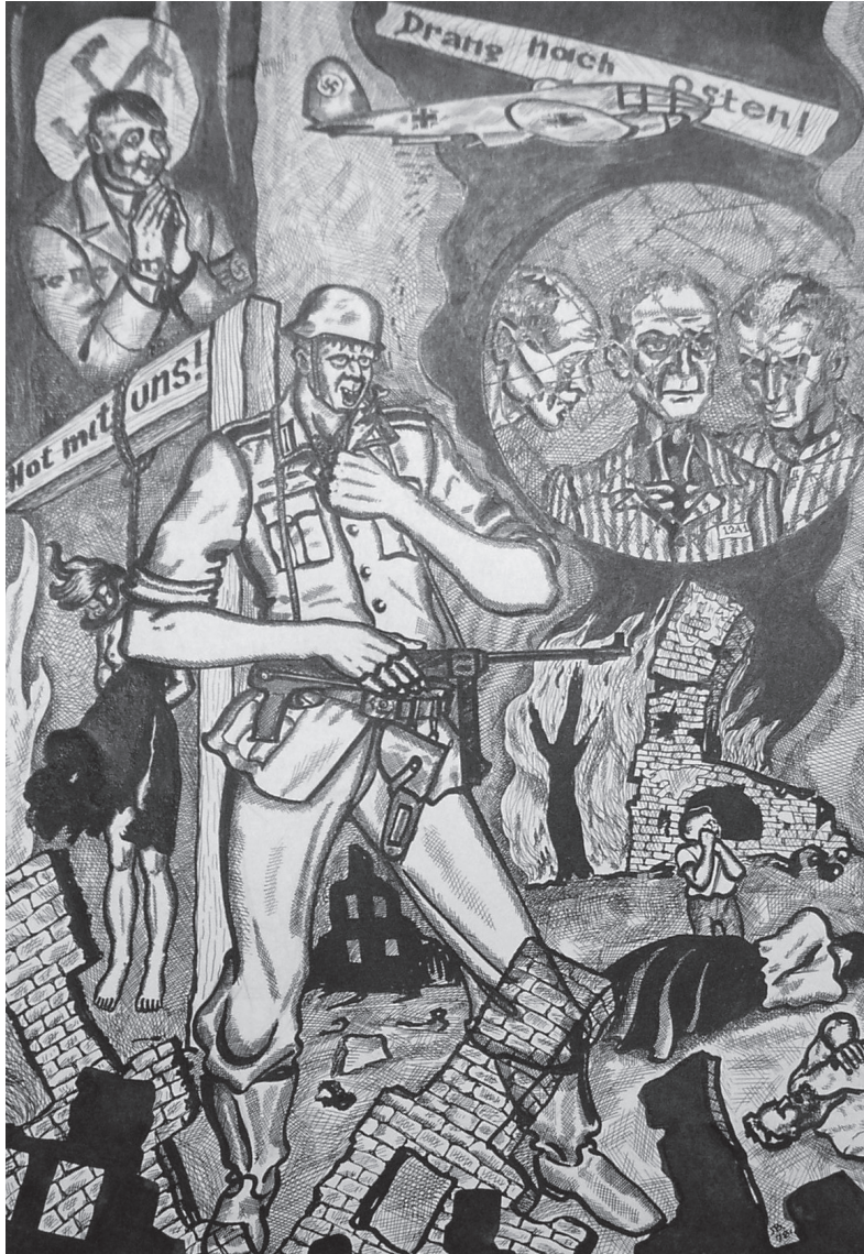
Deutsche Ordnung (Німецький порядок)